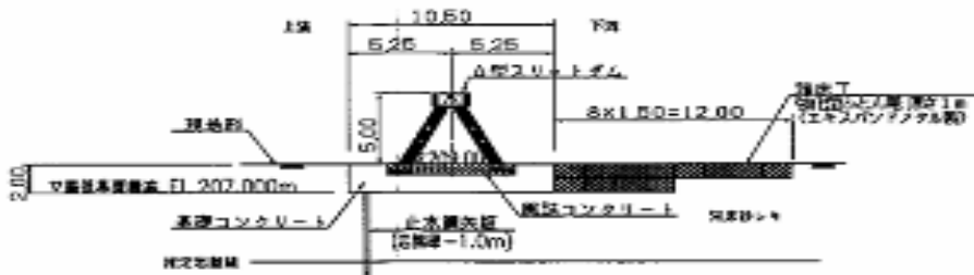
スリットダム横断面図