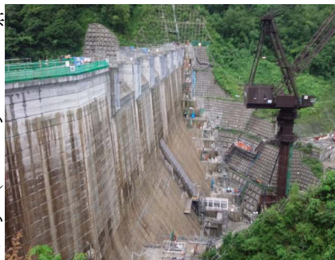
長野県の浅川ダム（建設中）

この浅川ダムは、田中康夫知事が「脱ダム宣言」で中止したのに、次の知事が復活させたもの。当時の議論で、「ダムの穴が詰まって洪水調節不能になる、危険なダムである」という論点はなかったのでしょうか。