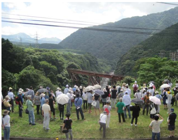
立野ダム予定地 現地調査 2014.8.17

熊本が世界に誇る阿蘇の玄関口である立野峡谷に、高さ90mの立野ダムが建設されようとしています。立野ダムは、阿蘇の大自然を破壊します。また、立野ダムは白川流域に安全をもたらすどころか、危険をもたらします。ダムより河川改修を進めるべきです。