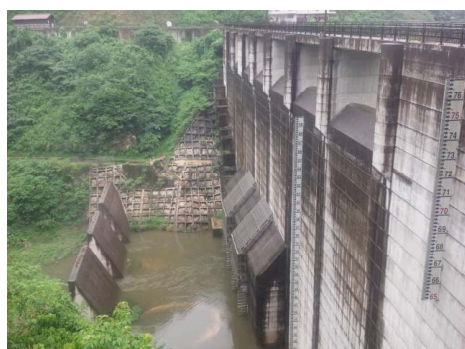
益田川ダム本体の上流側

ところが、計画中の立野ダムの場合は、洪水時、阿蘇カルデラ内の全ての流木や岩石、火山灰(ヨナ)などが立野ダム地点に集中します。「立野ダムの穴がふさがる」という点で、益田川ダムの例は参考になりません。