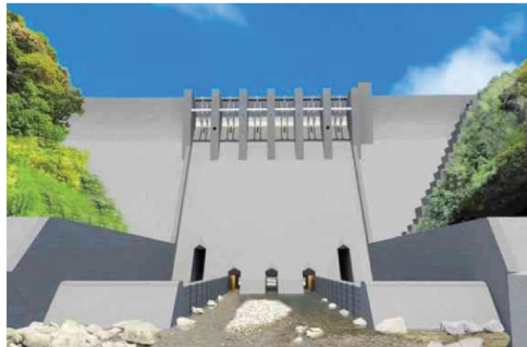
流水型の川辺川ダム完成予想図